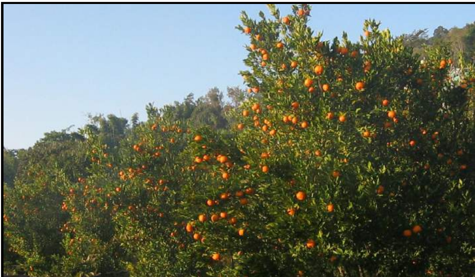
लटरम्म फलेका धनकुटाका चर्चित सुन्तला : एशियाकै स्वादिलो भनेर चर्चित धनकुटा खाल्सा क्षेत्रअन्तर्गत खोकुका कृषकका बारीमा लटरम्म फलेका सुन्तला ।